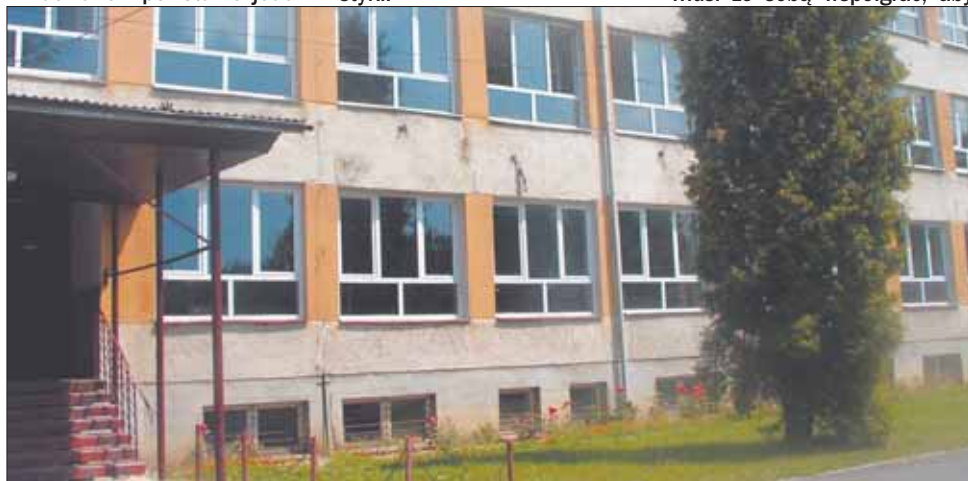
Zespół szkół który powstanie od 1 września, będzie mieścił się w starym Zespole Szkół Ekonomiczno-Rolniczych.