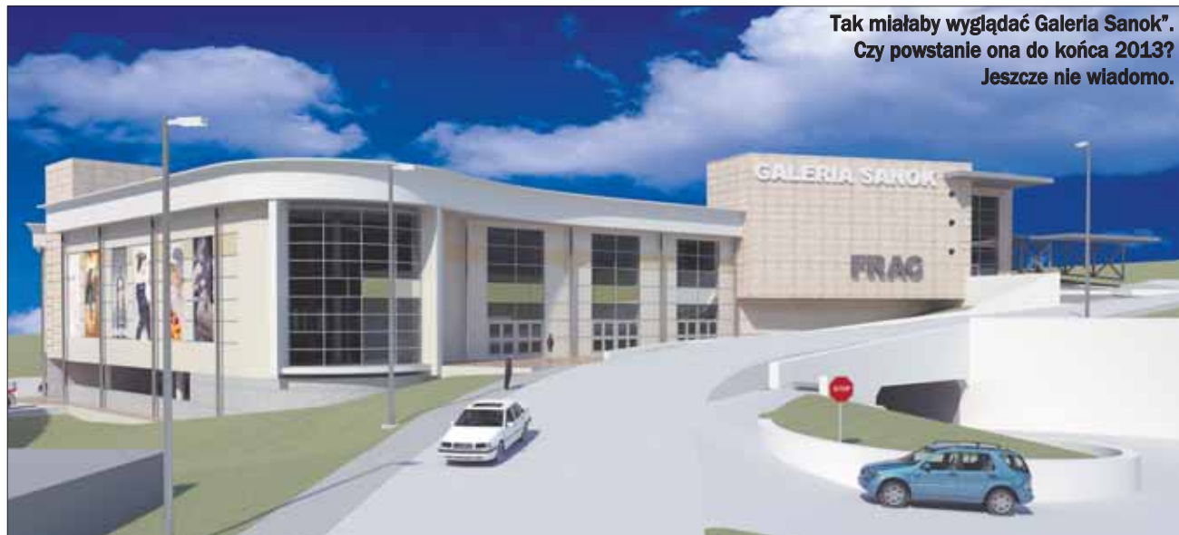
Tak miałyby wyglądać Galeria Sanok”. Czy powstanie ona do końca 2013? Jeszcze nie wiadomo.

SANOK. Kilkanaście miesięcy temu na Okęciu zlikwidowano przystanki autobusowe. Kierowcy i pasażerowie mieli przenieść się całkiem gdzie indziej. Wszystko dlatego, że w tym miejscu miała ruszyć budowa „Galerii Sanok”. Jednak do tej pory nic w tamtym miejscu się nie dzieje. Dlaczego? Postanowiliśmy to sprawdzić.