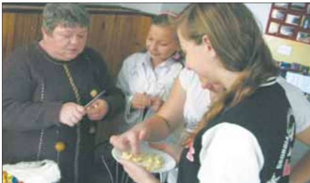
Młodzi wolontariusze chętnie biorą udział w pomocy przy lokalnych imprezach.

W wolontariacie działają zarówno osoby pełnoletnie, jak i dzieci z gimnazjum i podstawówki. Ich przygoda z wolontariatem zaczęła się niewinnie. Stowarzyszenie Kobiet Gminy Besko „Beskowiarki” realizowało projekt „Dla każdego coś dobrego” i do pomocy przy imprezach i spotkaniach potrzebowało wsparcia. Z tym w Besku problemu nie było. Młodzi mieszkańcy gminy z chęcią przyszli z pomocą – Młodzi wolontariusze wspierali np. organizację imprezy podsumowującej projekt „Dla każdego coś dobrego” i organizowaną przez nas i Urząd Gminy Beska wiecez w wigilijną dla osób starszych. Wolontariusze pomagali m. in. w dekorowaniu sali, stołów, sprzątanii i obsłudze. Bez nich byłoby nam naprawdę ciężko. Jedną z osób tak się zaangażowała, że zaczęła się także opiekować osobą niepełnosprawną w czasie zajęć lekcyjnych w klasie zerowej. Nasi wolontariusze mają już także swoje pierwsze sukcesy. Pod ko-