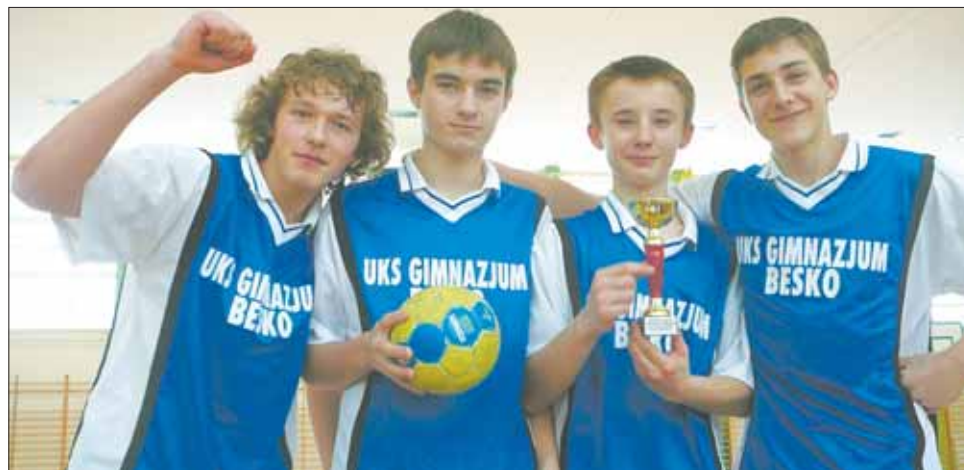
Młodzi sportowcy z chęcią pozowali. Nie chcieli wypuścić nagrody z rąk!

Patronat nas działalnością Koła Wolontariatu z Beska objęło Powiatowe Centrum Wolontariatu w Sanoku. RED