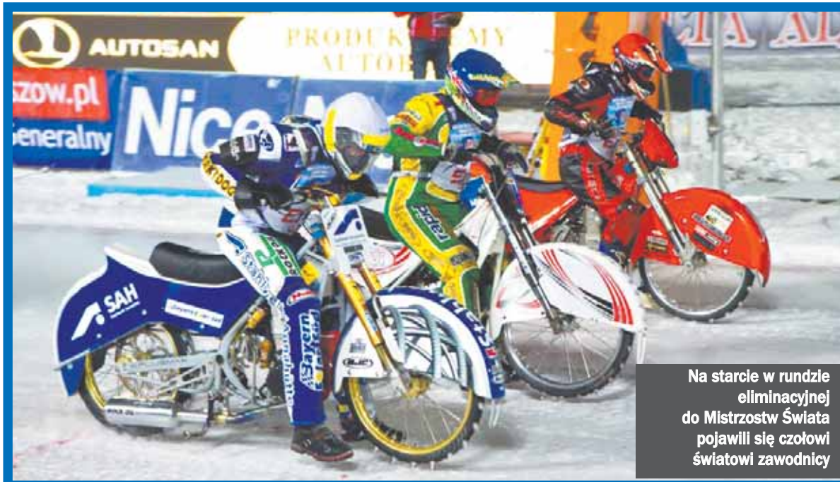
Na starcie w rundzie eliminacyjnej do Mistrzostw Świata pojawili się czołowi światowi zawodnicy