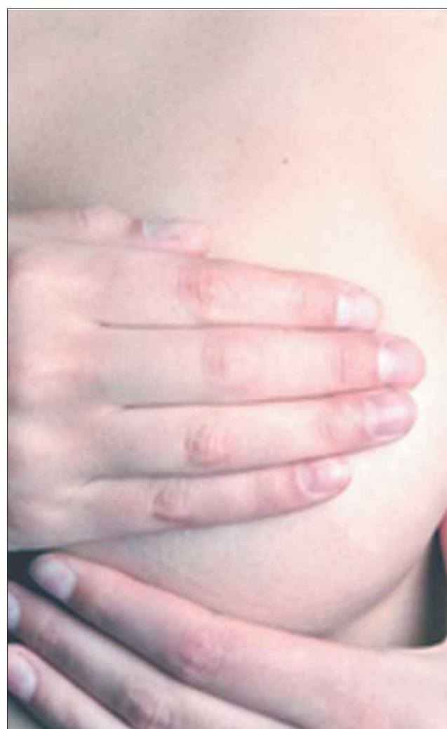
Rak piersi jest najczęściej występującym nowotworem u kobiet