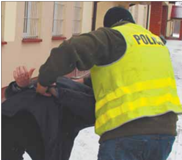
Oskarżonemu grozi dożywocie