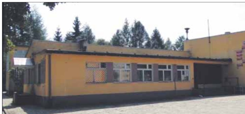
Budynek Zespołu Szkół Drzewnych nadaje się do generalnego remontu. Ten nie opłaca się.

Decyzja o likwidacji obu szkół średnich w Lesku nie była łatwa. Przy jej podejmowaniu pojawiło się wiele wątpliwości. Jednak Ci, którzy zajmują się sytuacją oświaty w powiecie leskim zapewniają, że będzie ona miała tylko pozytywne skutki. – Większa szkoła pod jednym zarządzaniem będzie miała większe szanse. Dyrektorem łatwiej będzie podejmować decyzje administracyjne i łatwiej będzie dostosować ofertę edukacyjną, która ma przekonać do siebie uczniów. Szkoła bez nauczyciela to nie szkoła, a szkoła bez ucznia nie ma po co istnieć. Jedno i drugie musi ze sobą współgrać, aby