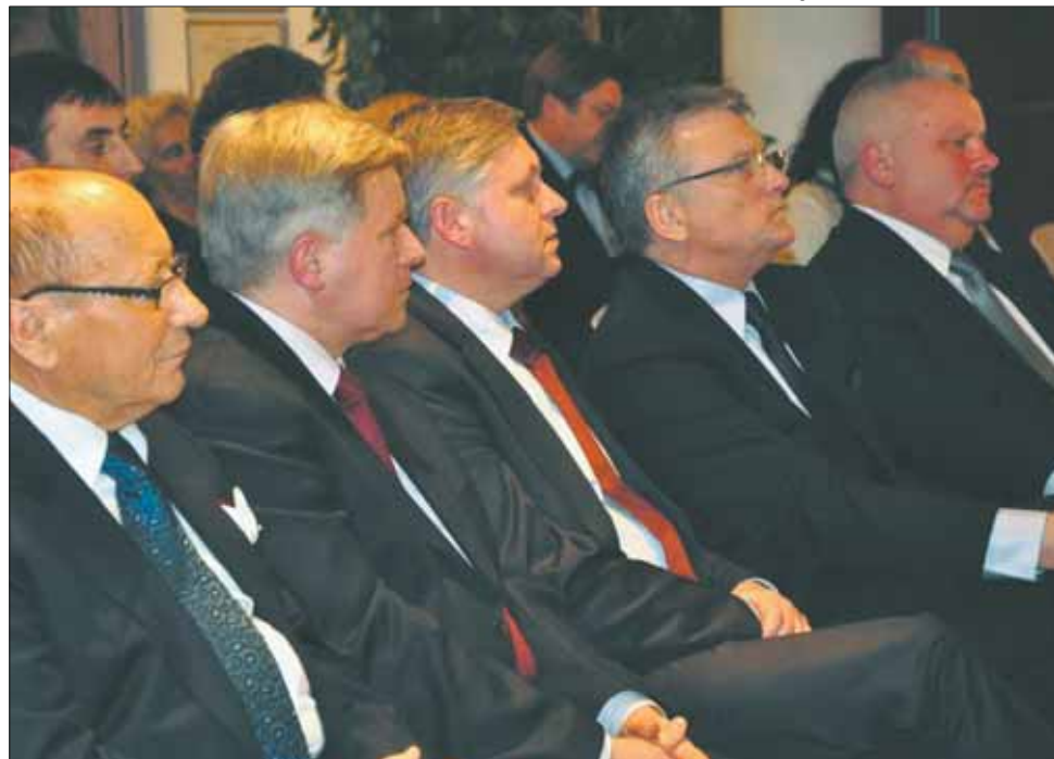
W spotkaniu udział wzięli przedstawiciele Jasła, Krosna i Sanoka.

Województwo podkarpackie objęło przewodnictwo w Domu Polski Wschodniej w Brukseli. Dla Jasła, Krosna i Sanoka, które tworzą Podkarpackie Trójmiasto, to świetna okazja na promocję.