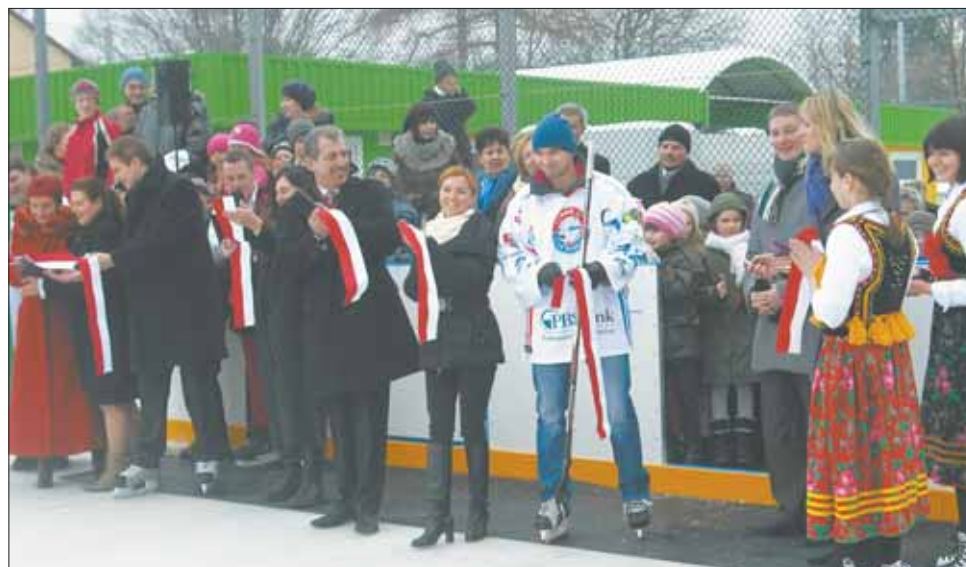
Uśmiechy na twarzach mówią same za siebie. Wszyscy są dumni z tej inwestycji.

W otwarciu wzięli udział także, znani sanocki hokeiści z Klubu Ciarko PBS Bank KH Sanok, którzy byli zachwyceni nowym obiektem. – Za czasów naszej młodości, wylewaliśmy wodę i ce-