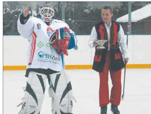
„Biały Orlik” już czynny! Mogą z niego korzystać i starsi, i młodszy.

Nowe lodowisko w Treczy to piękny prezent dla wszystkich dzieci na ferie zimowe. – Lodowisko jest dostępne dla wszystkich, bez względu na wiek i miejsce zamieszkania. Korzystanie z obiektu jest całkowicie bezpłatne – podkreśla gospodarz gminy, RED/ZG